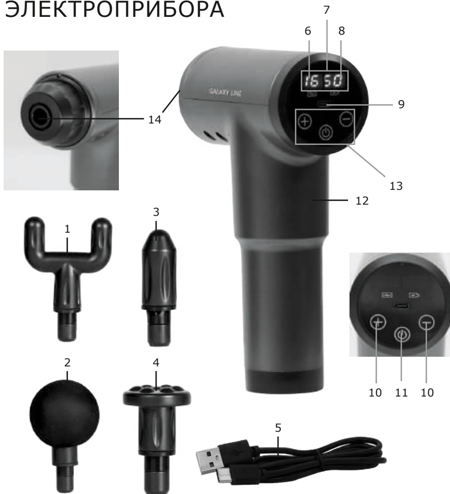
Рис. 1 Элементы электроприбора (Рис. 1):