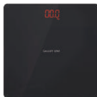
GL4826 ВЕСЫ БЫТОВЫЕ ЭЛЕКТРОННЫЕ