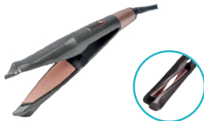
GL4521 ЩИПЦЫ ДЛЯ ВОЛОС