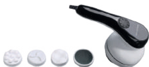
GL4943 МАССАЖЕР ДЛЯ ТЕЛА ЭЛЕКТРИЧЕСКИЙ

ИЗГНУТЫЕ ПЛАСТИНЫ ДЛЯ ВЫПРЯМЛЕНИЯ И ЗАВИВКИ ВОЛОС