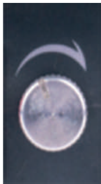
Рис. 1 Регулировка скорости распыления