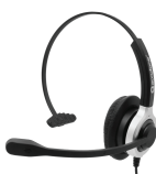
UM610MKII / UM610MKII ProNc UM610MKII ProNC Comfort

Accutone 610MKII – серия профессиональных гарнитур, разработанная для операторов call центров с интенсивным трафиком звонков, а также сотрудников офисов для разговоров по скайпу, компьютерной ip-телефонии и любых приложений, использующих USB гарнитуру.