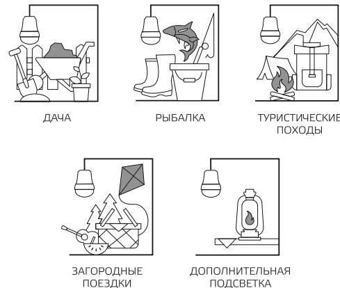
Рис.3. Сферы применения светильников