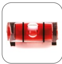
Встроенный уровень для точного монтажа