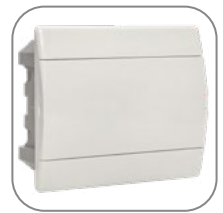
Исполнение с белой дверью