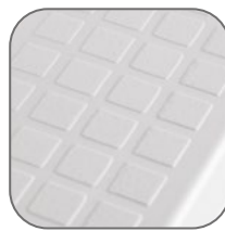
Разметка для подводки кабельного канала