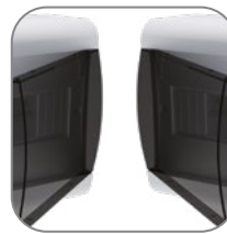
Левое и правое открытие двери