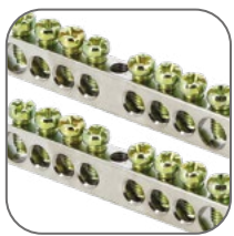
Шины N и PE в комплекте

Щиты распределительные пластиковые SlimBox EKF PROxima предназначены для установки модульной аппаратуры: автоматических выключателей, УЗО, таймеров, счетчиков электрической энергии и т. д. Используются для электромонтажа в жилых, административных, торговых помещениях. Электрощиты изготовлены из прочного ABS-пластика глянцевого белого цвета. Имеют полноразмерную затемненную дверцу, что позволяет им эстетично вписаться в интерьер жилых и офисно-торговых помещений. Основание корпуса у навесных щитов имеет малую высоту, что делает сборку щита и подключение проводов более удобным за счет большего свободного пространства для сборщика.