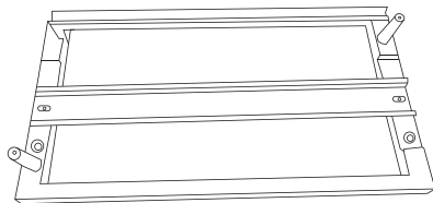
1. Монтажная рама (крепится к стене 4 саморезами и дюбелями)