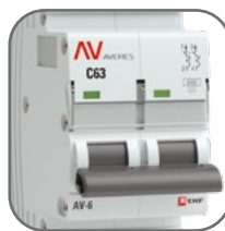
Литая лицевая панель