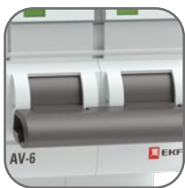
Механизм мгновенной коммутации (ММК)

Выключатели автоматические серии AV-6 EKF AVERES предназначены для оперативно-го управления участками электрических цепей, а также для защиты от токов перегрузки и короткого замыкания в административных, промышленных и жилых зданиях. Выключатели производятся в одно-, двух-, трех- и четырехполюсном исполнении. Номинальная наибольшая отключающая способность (Icn) 6000 А. Полный набор аксессуаров для расширения функций. Гарантийные обязательства 10 лет.