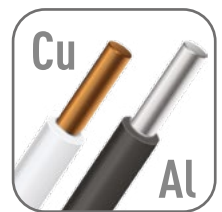
Возможна коммутация алюминиевым и медным проводником