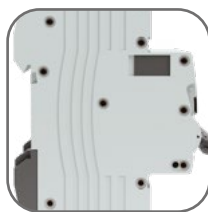
Жесткий корпус, 9 заклепок