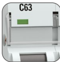
Удобное окно для маркировки цепи