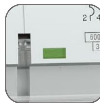
Окно реального состояния контактов с защитой от искр