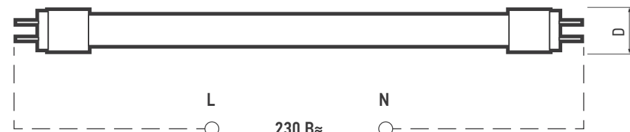
Рис. 1 Лампа T8 AGRO

Фирма производитель оставляет за собой право на внесение изменений в конструкцию Изделия, дизайн и комплектацию товара, не ухудшающих его потребительских характеристик.