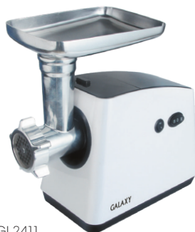
GL2411 МЯСОРУБКА ЭЛЕКТРИЧЕСКАЯ