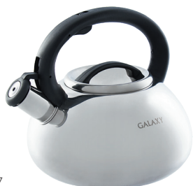
GL9207 ЧАЙНИК СО СВИСТКОМ