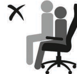
КРЕСЛО НЕ РАССЧИТАНО ДЛЯ ДВОИХ ЛЮДЕЙ!