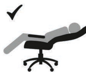
ВЕС ДОЛЖЕН БЫТЬ РАСПРЕДЕЛЕН НА ВСЕ СИДЕНЬЕ