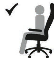
СИДИТЕ НА ВСЕМ СИДЕНИИ