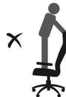
НЕ СТОЙТЕ НА КРЕСЛЕ