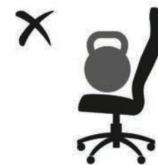
НЕ ПРЕВЫШАТЬ ДОПУСТИМЫЙ ВЕС