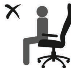
НЕ СИДИТЕ НА КРАЮ