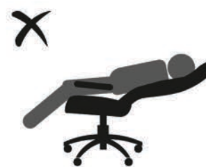
НЕ ОПИРАЙТЕСЬ НА СПИНКУ