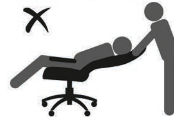
НЕ ОПИРАЙТЕСЬ НА СПИНКУ