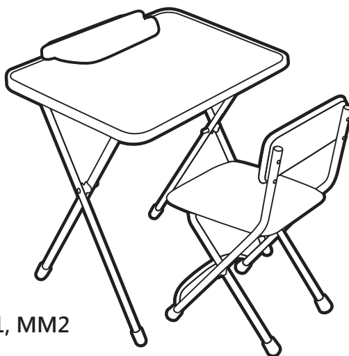
(рис. 1) арт. MM1, MM2