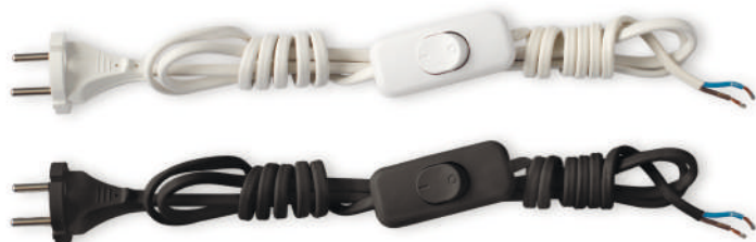
Выключатели для электроприборов проходные, установленные на шнуре армированном.