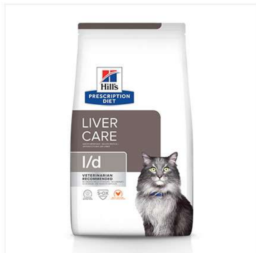
Hill's PRESCRIPTION DIET I/d. Диетический корм, который поддерживает функцию печени.

Hill's предлагает диетические корма для кошек при различных заболеваниях печени. Прежде, чем перевести кошку на PRESCRIPTION DIET, проконсультируйтесь с ветеринарным специалистом. На все корма Hill's действует программа 100% ГАРАНТИЯ КАЧЕСТВА, КОНСИСТЕНЦИИ И ВКУСА или мы вернем деньги, чтобы Вы были уверены, выбирая Hill's.