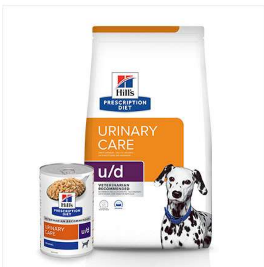
Hill's PRESCRIPTION DIET u/d. Корм, который снижает риск образования уратных и цистинных уролитов.

Hill's предлагает широкий ассортимент диетических кормов для поддержания здоровья мочевыводящих путей, отвечающих уникальным потребностям Вашей собаки. Прежде, чем перевести собаку на PRESCRIPTION DIET, проконсультируйтесь с ветеринарным специалистом. На все корма Hill's действует программа 100% ГАРАНТИЯ КАЧЕСТВА, КОНСИСТЕНЦИИ И ВКУСА или мы вернем деньги, чтобы Вы были уверены, выбирая Hill's.