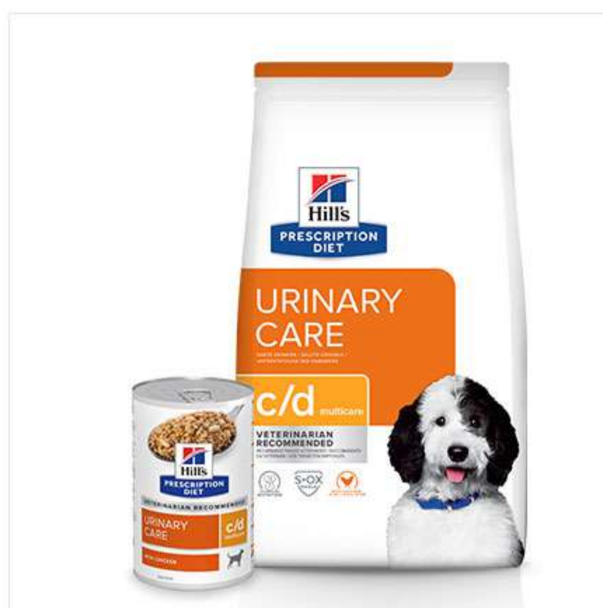
Hill's PRESCRIPTION DIET c/d Multicare. Питание с клинически доказанной эффективностью: снижает риск образования основных видов уролитов в мочевыводящих путях и растворяет струвитные уролиты.