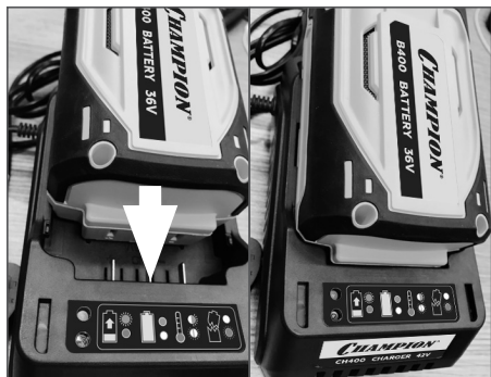
Рис. 2 Установка аккумулятора в зарядное устройство

Если аккумулятор слишком горячий, красный и зеленый свет будут мигать. Если аккумулятор сломан, красный свет начнет мигать (Рис. 3).