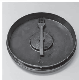
Щетка для чистки