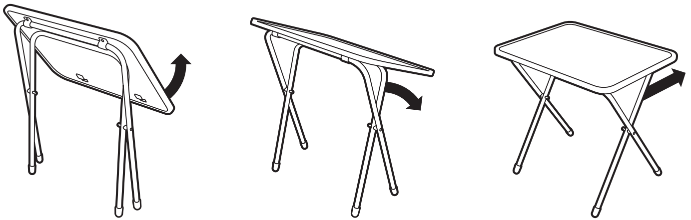
(рис. 2) Схема раскладывания стола