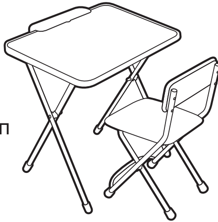
(рис. 1) арт. КПМ/П

Перед эксплуатацией следует ознакомиться с паспортом и руководством по эксплуатации. Следуя инструкции, выполните установку стола и стула.