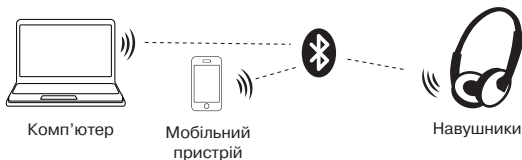
Мал. 2. Схема підключення