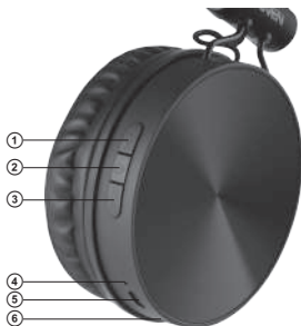
Fig. 1. Headphones design