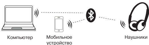
Рис. 2. Схема подключения